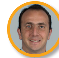
Renaud PFEFFER Maire de Mornant