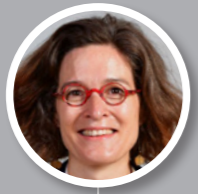
Emeline BAUME 1e vice-présidente de la métropole de Lyon