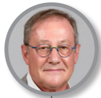
Gilbert-Luc DEVINAZ Conseiller de la métropole de Lyon, Sénateur du Rhône