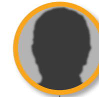
Membre du bureau du CA