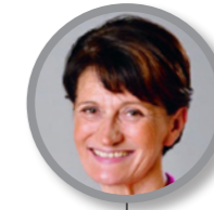
Claire PEIGNÉ Maire de Morancé