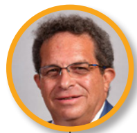
Bertrand ARTIGNY 9e vice-président de la métropole de Lyon