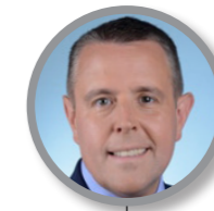
Patrice VERCHÈRE Maire de Cours Président de la communauté d'agglomération de l'Ouest Rhodanien