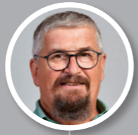
Pierre ATHANAZE 11e vice-président de la métropole de Lyon