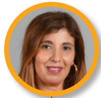
Zémorda KHELIFI 10e vice-présidente de la métropole de Lyon